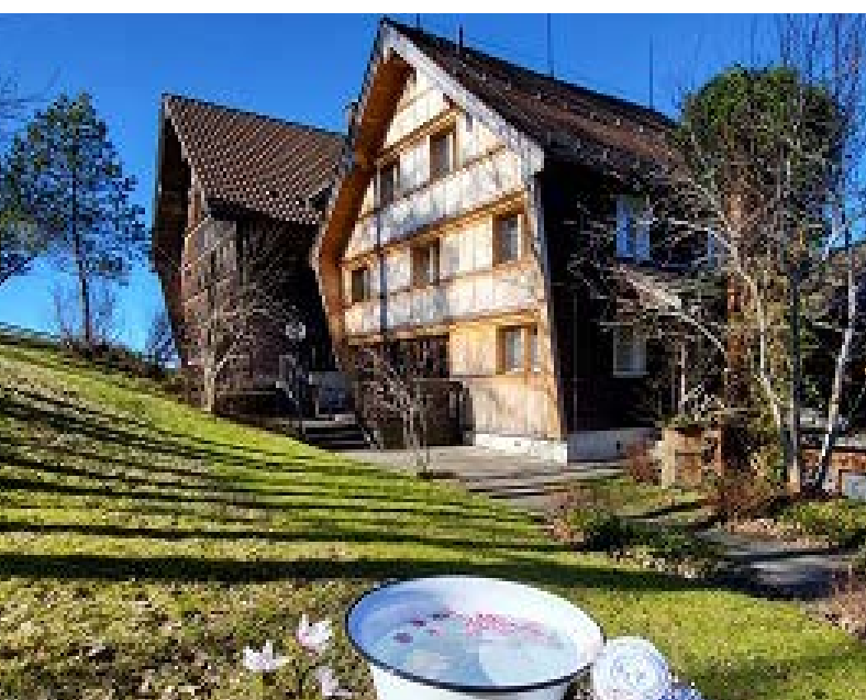
Unser Seminarhaus Idyll in Gais

Das IBP Integrationsmodell: Integration entsteht durch (Wieder-)Verbindung der drei Erlebensdimensionen Körpererleben, Emotionen und Kognitionen.